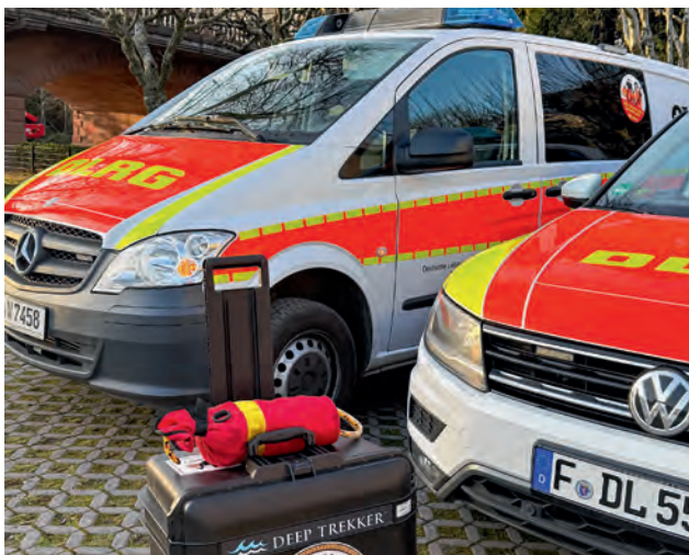
Die Einheit ist hochmobil und kommt in jedem Gelände zurecht. © privat (3)