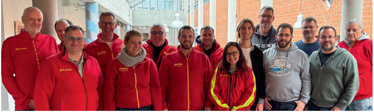
Bezirks- und Kreisverbandsleiter sowie LV-Vorstand stellten gemeinsam die Weichen für die Zukunft.