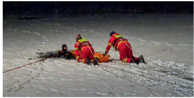
Rettung mit Schleifkorbtrage und Spineboard.

Ein weiteres Augenmerk lag auf der Zusammenarbeit mit der örtlichen Freiwilligen Feuerwehr. Diese brachte ihre Steckleitern ein, die als zusätzliche Rettungsmittel auf dem Eis genutzt wurden. Durch die großflächige Lastverteilung erhöhen sie die Sicherheit der Einsatzkräfte erheblich und ermöglichen eine stabile Annäherung an die Einsatzstelle. Im Rahmen der Übung erfolgte zudem eine ausführliche Einweisung der Einsatzkräfte, insbesondere zu den besonderen Gefahren der Eisrettung.