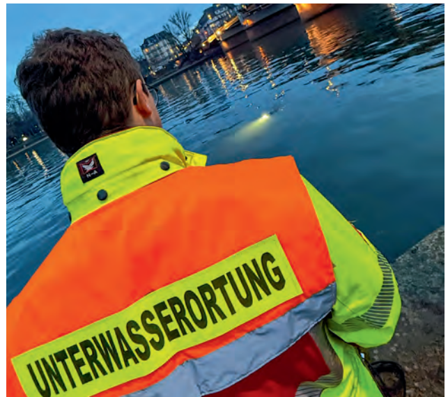
Mit der neuen Einheit ist die DLRG Frankfurt noch besser aufgestellt.